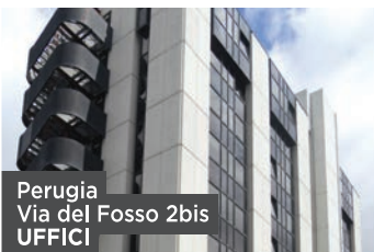
Perugia Via del Fosso 2bis UFFICI