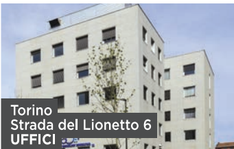
Torino Strada del Lionetto 6 UFFICI