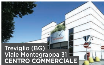
Treviglio (BG) Viale Montegrappa 31 CENTRO COMMERCIALE

Eventuali soggetti interessati a partecipare al processo possono contattare Cushman & Wakefield, in qualità di advisor esclusivo per la vendita. Le manifestazioni di interesse dovranno pervenire secondo le modalità previste dalla procedura di vendita, entro e non oltre il 28 Marzo 2022.