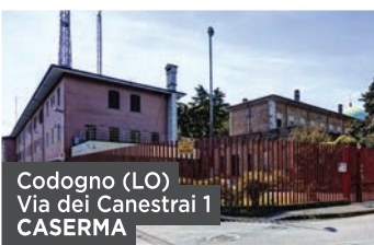
Codogno (LO) Via dei Canestrai 1 CASERMA