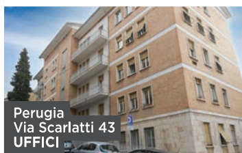
Perugia Via Scarlatti 43 UFFICI