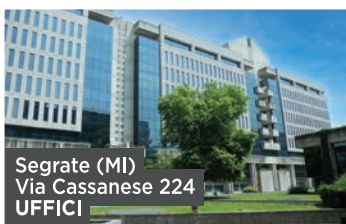
Segrate (MI) Via Cassanese 224 UFFICI