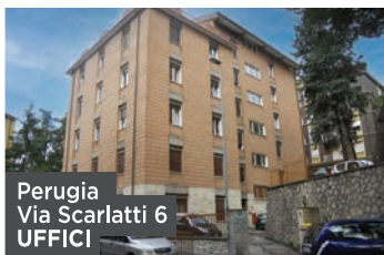
Perugia Via Scarlatti 6 UFFICI