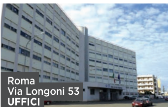
Roma Via Longoni 53 UFFICI