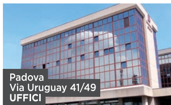
Padova Via Uruguay 41/49 UFFICI