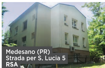
Medesano (PR) Strada per S. Lucia 5 RSA

Fabbrica Immobiliare SGR in qualità di gestore del Fondo Socrate , Fondo Comune di Investimento di Tipo Chiuso, ha avviato una procedura di vendita degli immobili di proprietà del Fondo. L'intero portafoglio è costituito da 12 immobili cielo-terra a destinazione mista, ubicati nel nord e centro Italia. La vendita del portafoglio è in blocco.